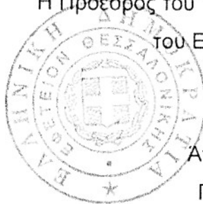
Αννα Μιχαλοπούλου Πρόεδρος Εφετών

Η Πρόεδρος του Τριμελούς Συμβουλίου Διεύθυνσης του Εφετείου Θεσσαλονίκης