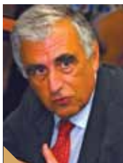
Κωνσταντίνος Μενουδάκος Πρόεδρος του Συμβουλίου της Επικρατείας

Ε υχαριστώ το Δικηγορικό Σύλλογο για την τιμητική για μένα πρόσκληση να έρθω να παρευρεθώ σε αυτή την πολύ ενδιαφέρουσα εκδήλωση που, όπως καταλαβαίνω, εντάσσεται σε μια σειρά εκδηλώσεων που αποτελούν πλέον παράδοση εδώ στη Θεσσαλονίκη – εκδηλώσεων του ΔΣΘ με θέματα τα οποία δεν εγκλωβίζονται στα φορμαλιστικά πεδία ημών των νομικών, έχουν τις νομικές πτυχές τους, αλλά αφορούν γενικότερα την κοινωνία.