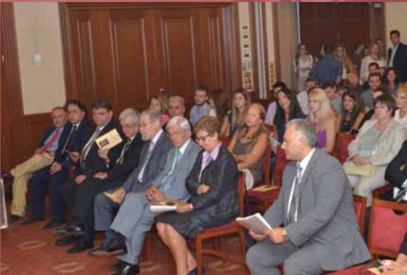
■ Γενική άποψη του κοινού