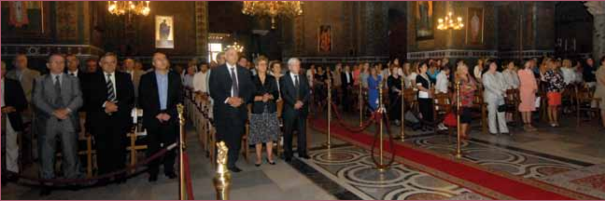
■ Κατάμεστος ο Ι.Ν. Αγίας Σοφίας