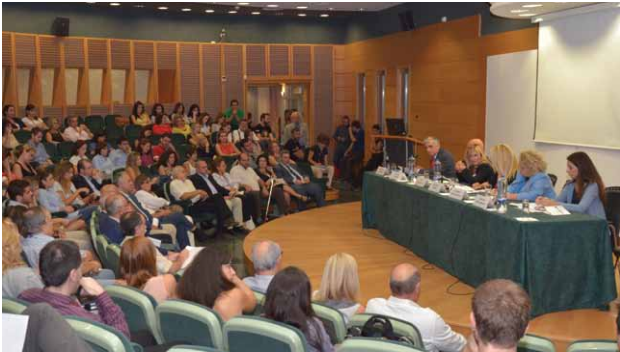
■ Γενική εικόνα κοινού

άρθρου 6, παράγραφος 1 για την εύλογη δίκη και του άρθρου 13 της Ευρωπαϊκής Σύμβασης για τα Δικαιώματα του Ανθρώπου.