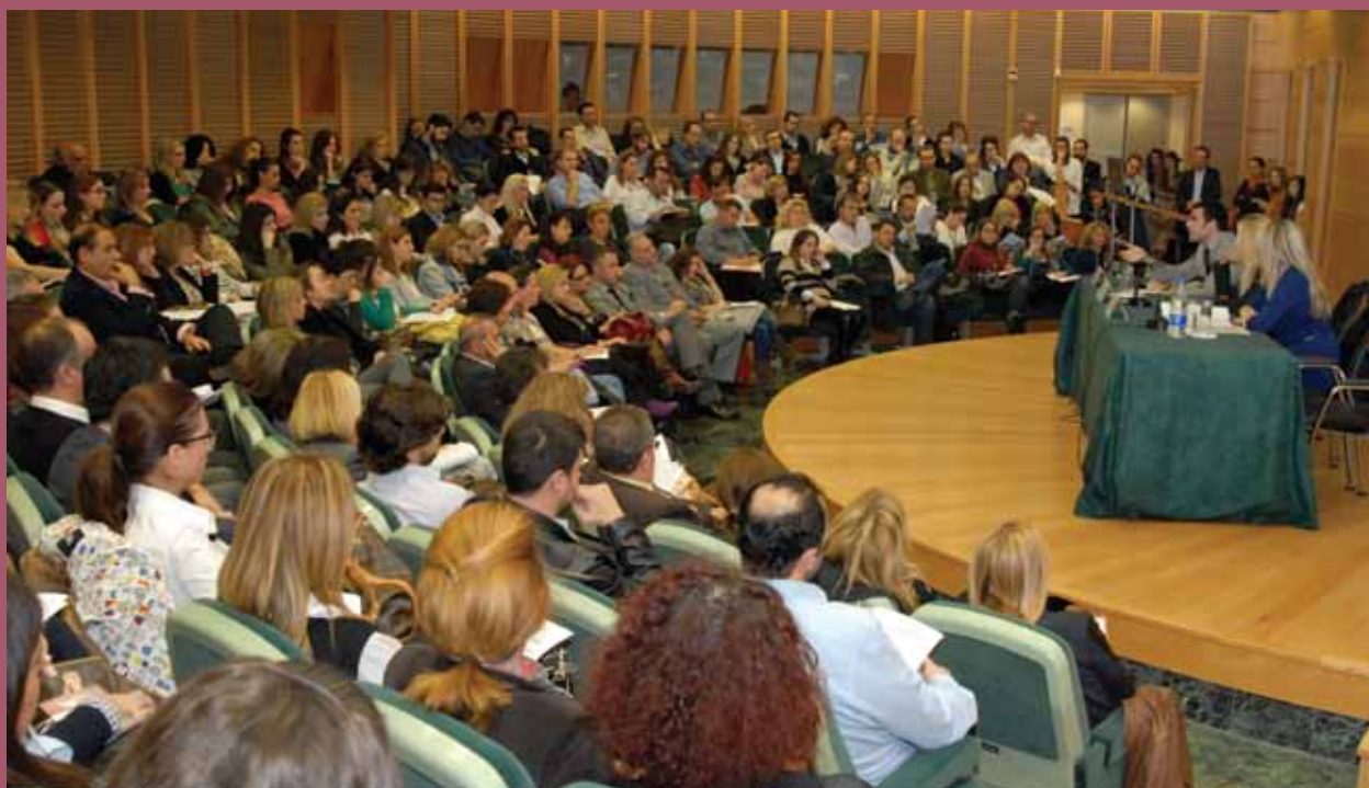
■ Γενική άποψη της εκδήλωσης

Στο πλαίσιο αυτό, διοργάνωσε επιστημονική εκδήλωση με θέμα «Πρακτικός Οδηγός Διαμεσολάβησης για Δικηγόρους» την Τετάρτη 7 Νοεμβρίου 2012 και ώρα 19:00 στο Συνεδριακό Κέντρο της Τράπεζας Πειραιώς (Κατούνη 12-14, Λαδάδικα).