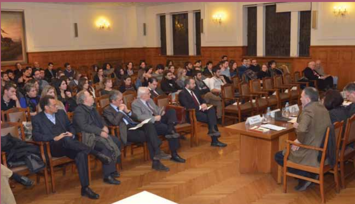
■ Γενική άποψη της εκδήλωσης.