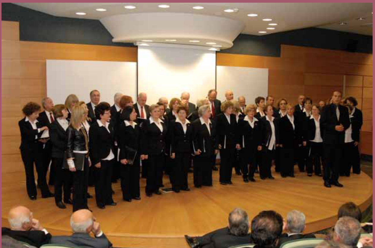
■ Η Μεικτή Χορωδία του Δήμου Καλαμαριάς