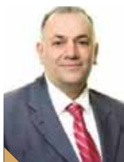
Νικόλαος Βαλεργάκης Πρόεδρος Δικηγορικού Συλλόγου Θεσσαλονίκης