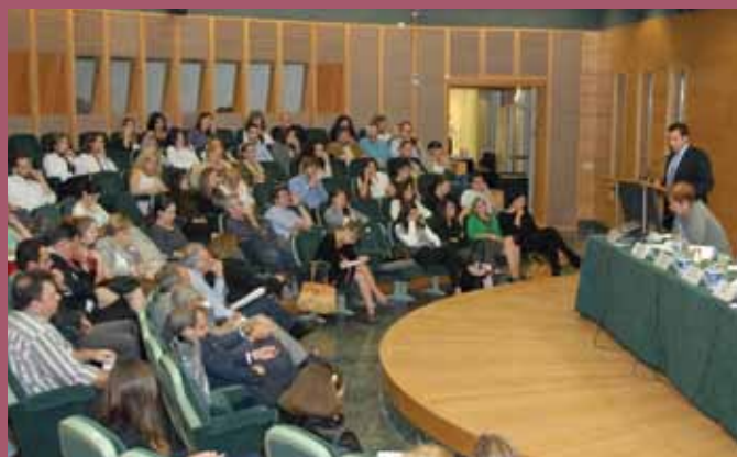
■ Γενική άποψη της εκδήλωσης