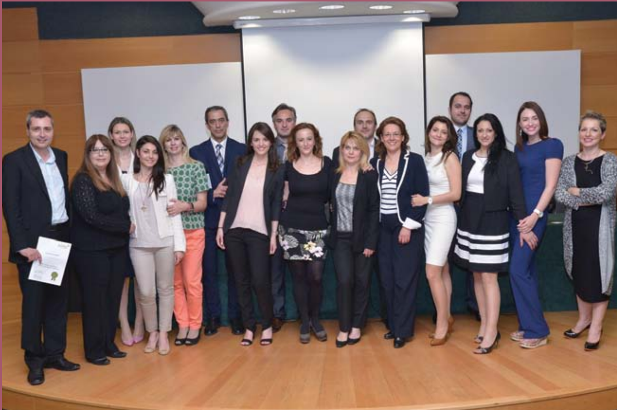
■ Οι νέοι διαμεσολαβητές με τον τίτλο εκπαίδευσης ανά χείρας