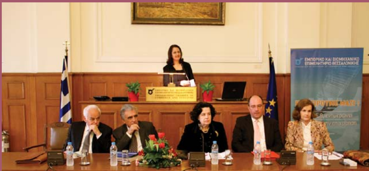
■ Από αριστερά: Αντώνης Μανιτάκης Ομ. Καθηγητής ΑΠΘ, Κων/νος Μενουδάκος , Επίτιμος Πρόεδρος Συμβουλίου Επικρατείας, Δήμητρα Κοντόγιωργα-Θεοχαροπούλου , Ομ. Καθηγήτρια ΑΠΘ, Κων/νος Γιαννακόπουλος , επ. καθηγητής ΕΚΠΑ, τ. εισηγητής στο Δικαστήριο των Ευρωπαϊκών Κοινοτήτων, Αικατερίνη Σαμώνη-Ράντου , Διευθύντρια Ειδικής Νομικής Υπηρεσίας δικαίου ΕΕ/ΥΠΕΞ. Στο Βήμα η Λίνα Παπαδοπούλου