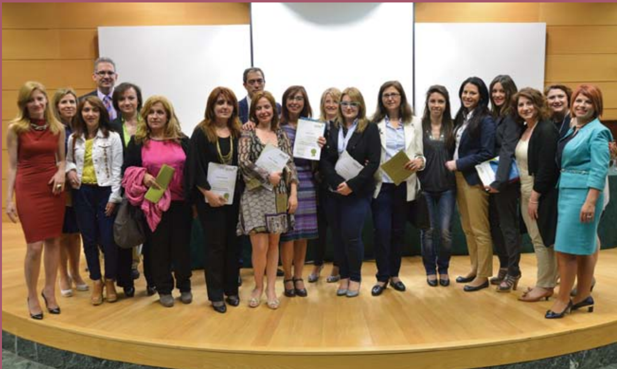
■ Οι νέοι διαμεσολαβητές με τον τίτλο εκπαίδευσης ανά χείρας