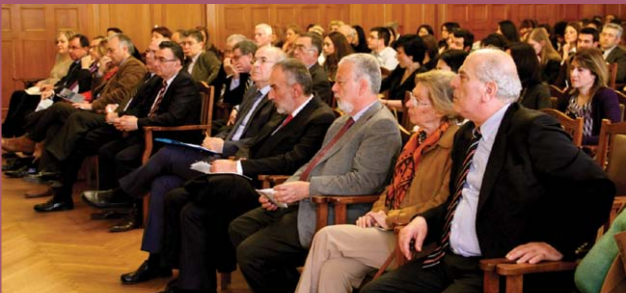
■ 'Αποψη κοινού