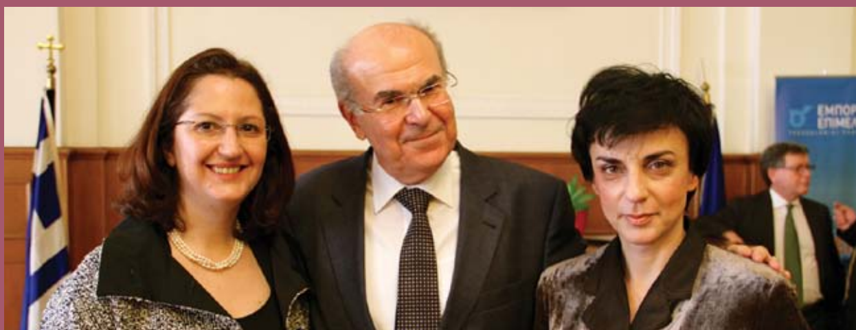
■ Από αριστερά: Λίνα Παπαδοπούλου , Έδρα Jean Monnet Ευρωπαϊκού Συνταγματικού Δικαίου και Πολιτισμού ΑΠΘ, Βασίλειος Σκουρής , Καθηγητής ΑΠΘ, Πρόεδρος του Δικαστηρίου της ΕΕ, Ευγενία Πρεβεδούρου , Αν. καθηγήτρια ΑΠΘ