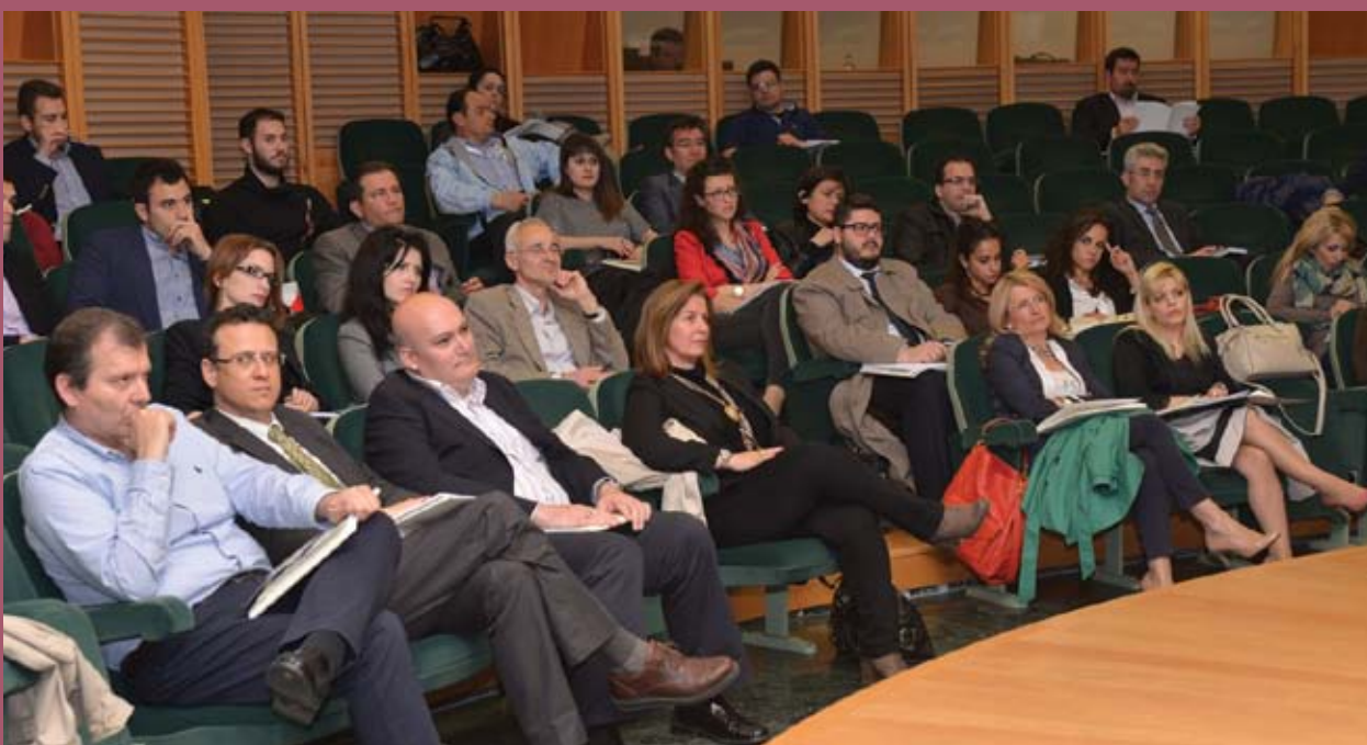
■ Άποψη από το κοινό