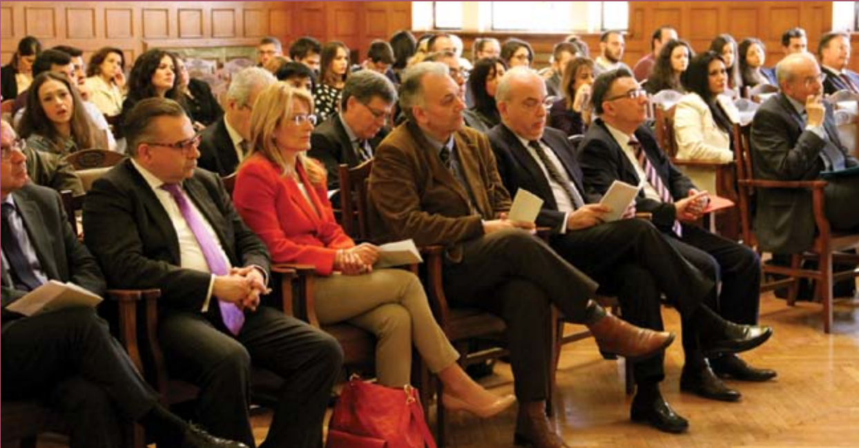
■ Άποψη από την κατάμεστη αίθουσα του Εμπορικού και Βιομηχανικού Επιμελητηρίου