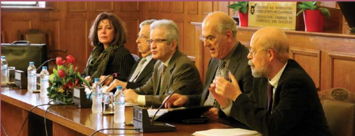
■ Από αριστερά: Ιφιγένεια Καμτσιδου , Αν. καθηγήτρια ΑΠΘ, Χρήστος Ροζάκης , Πρόεδρος του Διαιτητικού Δικαστηρίου του Συμβουλίου της Ευρώπης, πρ. Δικαστής ΕΔΑΑ, Μιχαήλ Βηλαράς , Σύμβουλος Επικρατείας, πρ. Πρόεδρος Τμήματος του Γενικού Δικαστηρίου της ΕΕ, Ιωάννης Κουκιάδης , Ομ. Καθηγητής ΑΠΘ, Πέτρος Στάγκος , Καθηγητής ΑΠΘ.