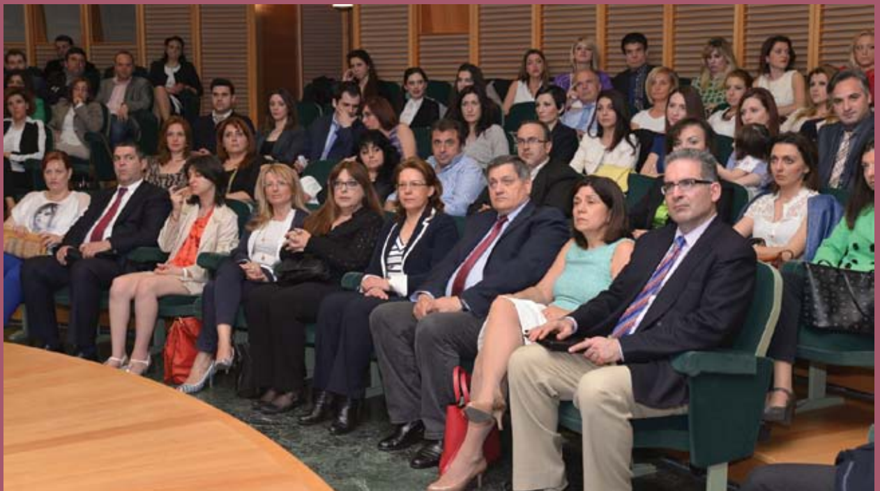
■ Άποψη από το κοινό

Η εκδήλωση ολοκληρώθηκε με την εισήγηση του Rahim Shamji , Διευθυντή Εκπαίδευσης & Κατάρτισης ADR Group, UK, με θέμα «The Role of Continuing Education as a Mediator».