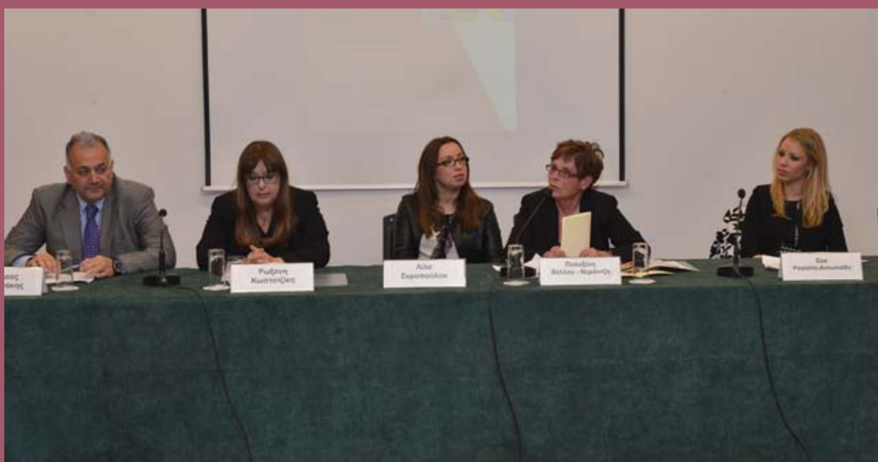
■ Το πάνελ της εκδήλωσης