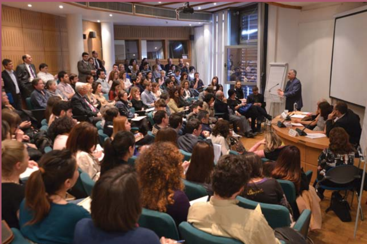
■ Γενική άποψη του κοινού